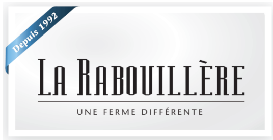
Table champêtre LA RABOUILLÈRE 1073 Rang de l'Égypte, St-Valérien-de-Milton Possibilité de co-voiturage pour ceux qui le désirent